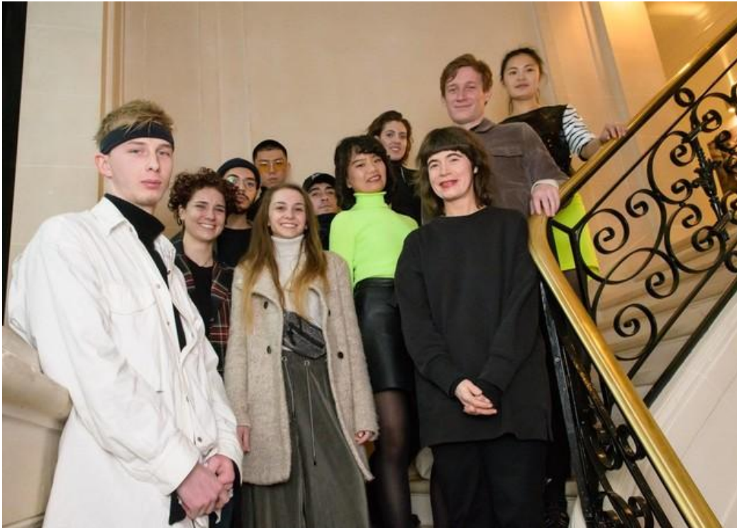
Les 12 créateurs en lice au Festival des Créateurs de Mode Dinan 2019