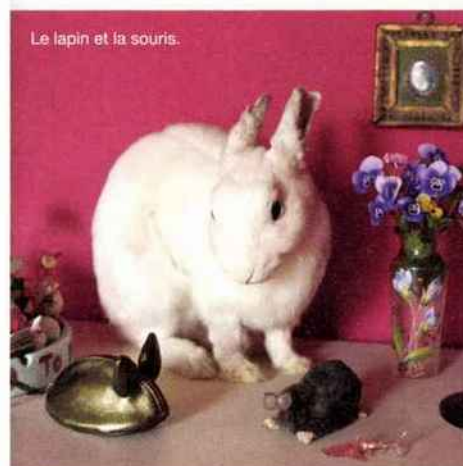
Le lapin et la souris.

En 2017, j'ai rejoint un atelier collectif dans le XX e arrondissement de Paris. C'est une vraie bouffée d'oxygène. Avant je faisais tout chez moi, mais j'avais vraiment besoin de séparer le professionnel et le privé. ●