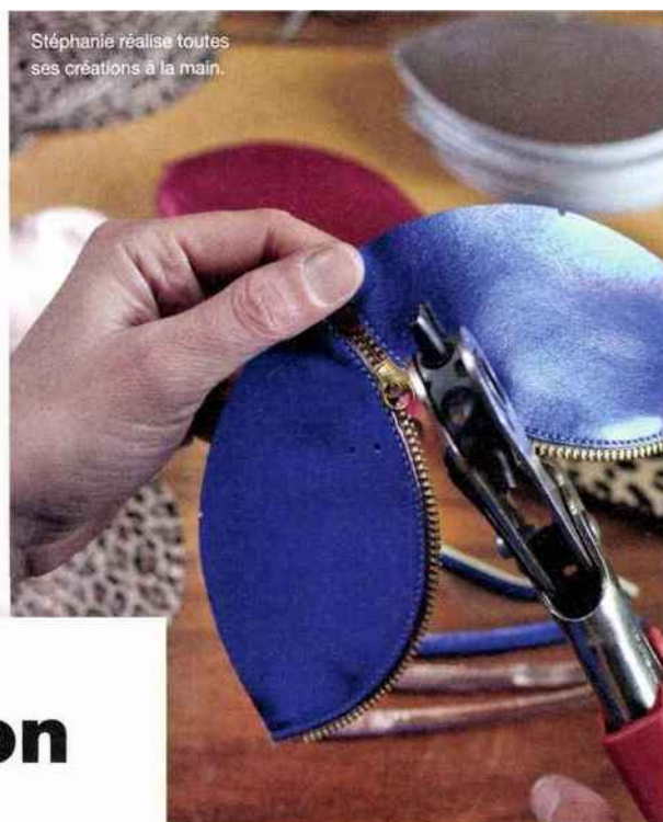
Stéphanie réalise toutes ses créations à la main.