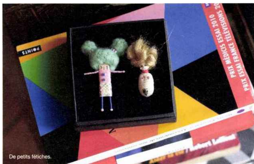
De petits fétiches.