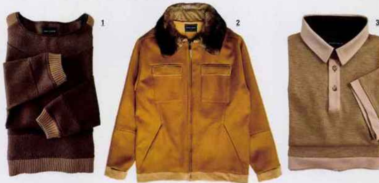
1-Sweat Batistin en jersey de laine contrasté laine bouclette et bords-côtes, 370 €. 2- Field Jacket Rhéad en laine vierge avec empiècements drap de cachemire et velours côtelé, doublure soie et col en lapin Orylag, 1 120 €. 3- Polo Luxembourg en piqué de coton et twill, 189 €.

chèvre velours, etc. Des matières naturelles toutes sourcées en France, en Italie ou en Angleterre. Randry aime les mixer, les juxtaposer, mais toujours dans un contraste doux ou ton sur ton. C'est même sa marque de fabrique, ce mélange de textures. Ainsi sur le sweat Valentin, un jersey de coton et cachemire flirte avec un velours côtelé ; sur la field Jacket Rhead, une laine vierge contraste avec un drap de cachemire et un velours côtelé ; sur le chino Granit, la gabardine joue un triptyque avec un lin et un cuir d'agneau. Tout est soigné jusque dans l'étiquette du vêtement qui indique de façon presque manuelle, le nom du produit ou la collection. Ici pas de frénésie. On se laisse bercer par une slow fashion qui regarde l'avenir. À chaque saison, des intemporels reconduits et des éditions spéciales. Des petites séries qui donnent presque la sensation