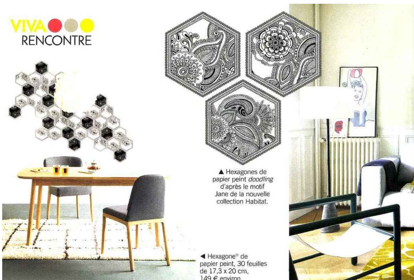
▲ Hexagones de papier peint doodling d'après le motif Jane de la nouvelle collection Habitat.