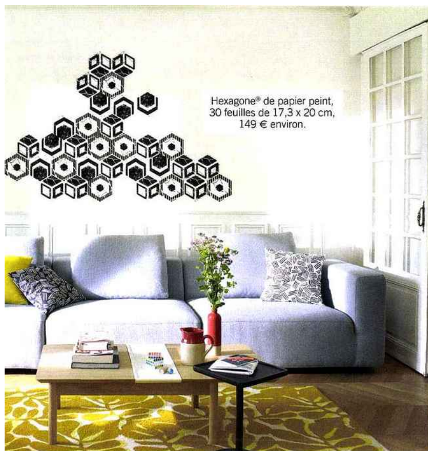
Hexagone® de papier peint, 30 feuilles de 17,3 x 20 cm, 149 € environ.